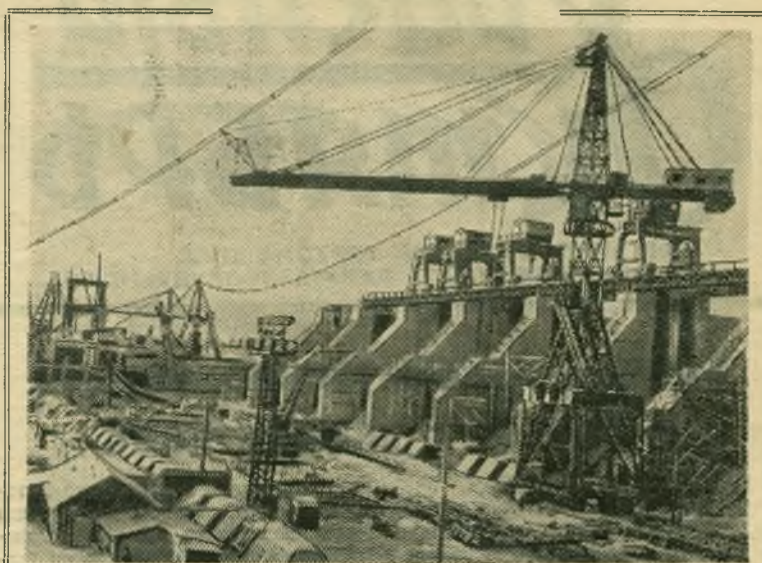
На строительстве Горьковской гидроэлектростанции. Сооружение водосливной плотины.