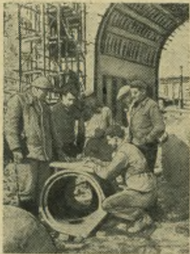
Чехословацкая Республика. Сбор подписей под Обращением Всемирного Совета Мира против подготовки атомной войны.