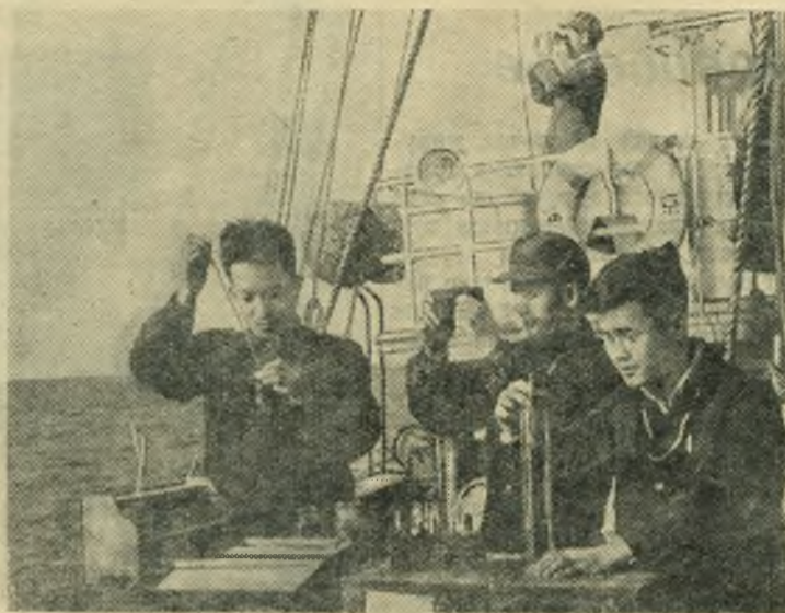
Работа институтов китайской Академии наук тесно связана с практикой. Ученые разрабатывают проблемы, имеющие важное значение для развития промышленности, транспорта, сельского хозяйства.

Сейчас создана группа, в которую входят представители китайской Академии наук, Министерства сельского хозяйства, Шаньдунского университета и ряда институтов. Группа работает над вопросами дальнейшего развития рыбного хозяйства страны.