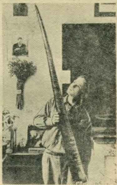
Уголок юных натуралистов средней школы № 1 недавно пополнился редким и очень интересным экспонатом — усом нита.

Вот несколько примеров. В школе оборудовали столярную мастерскую, но инструмента для нее не хватало. Нужны были топоры, молотки, стамески. Ребята, конеч-