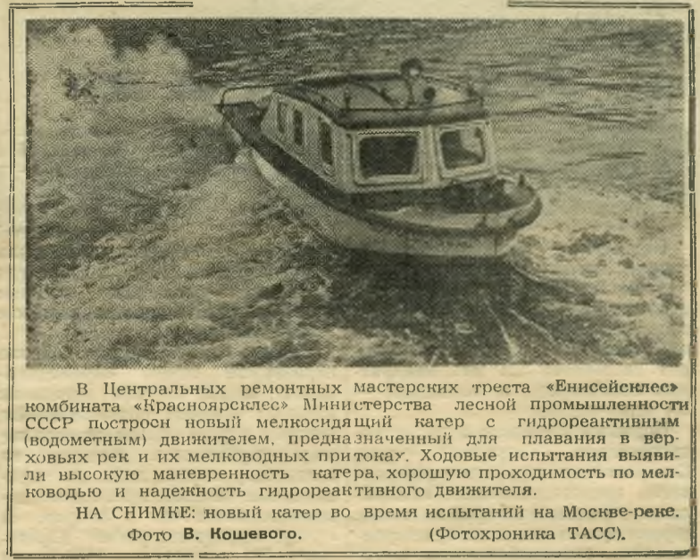
В Центральных ремонтных мастерских треста «Енисейсклес» комбината «Красноярсклес» Министерства лесной промышленности СССР построен новый мелкосидящий катер с гидрореактивным (водометным) двигателем, предназначенный для плавания в верховьях рек и их мелководных притоках. Ходовые испытания выявили высокую маневренность катера, хорошую проходимость по мелководью и надежность гидрореактивного двигателя.