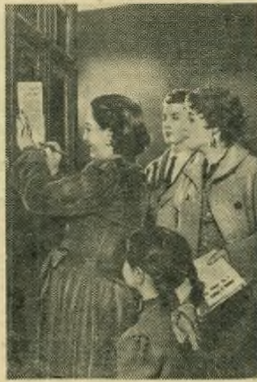
Италия. Сбор подписей в Риме под Обращением Бюро Всемирного Совета Мира против подготовки атомной войны.

Только проведение независимой политики, свободной от агрессивных военных блоков, и поддержание добрососедских отношений с Советским Союзом обеспечат подлинную безопасность Норвегии — таков вывод, к которому приходит все большее число норвежцев.