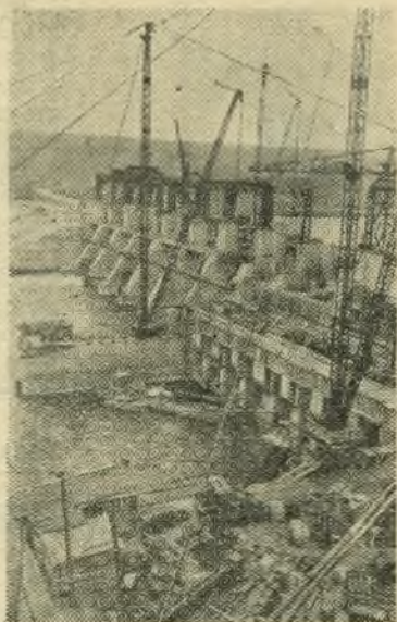
Молдавская ССР. Строители Дубоссарской гидроэлектростанции одержали крупную производственную победу. Два агрегата дали промышленный ток.

НА СНИМКЕ: общий вид строительства Дубоссарской гидроэлектростанции.