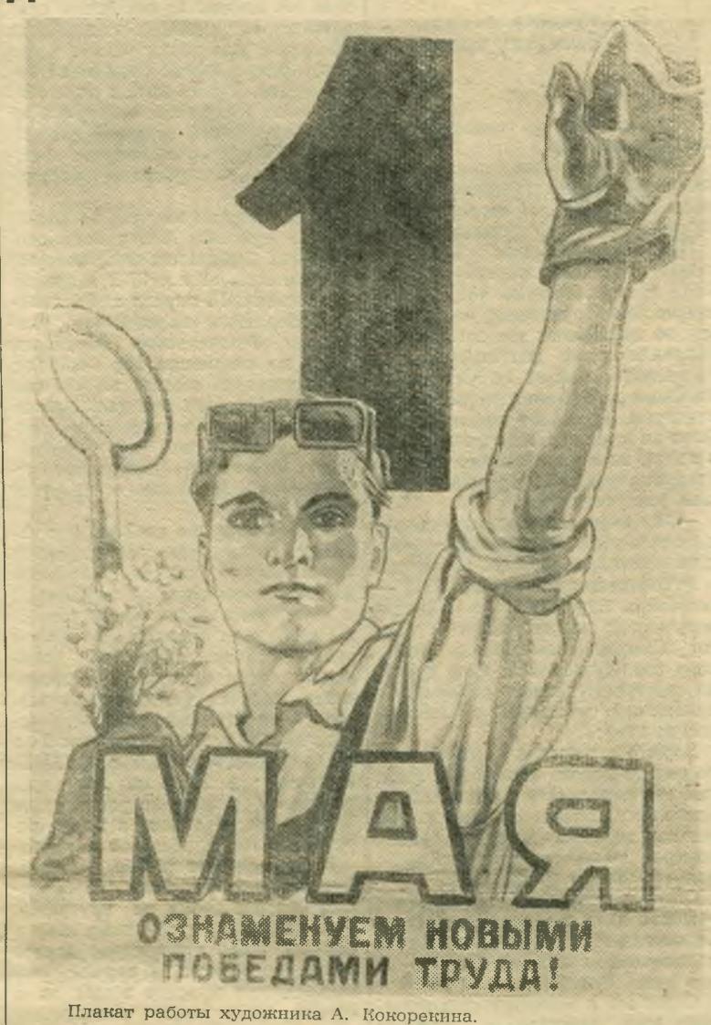
Планат работы художника А. Кокореккина.