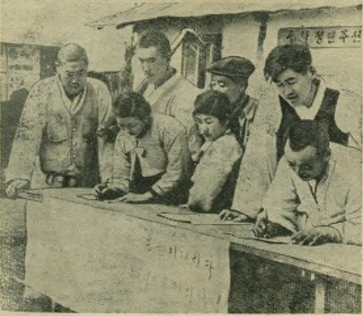
В Корейской Народно-Демократической Республике ширится кампания по сбору подписей под Обращением Бюро Всемирного Совета Мира о запрещении атомного оружия.

НА СНИМКЕ: члены сельскохозяйственного производственного кооператива провинции Южный Пхенан подписываются под Венским Обращением.