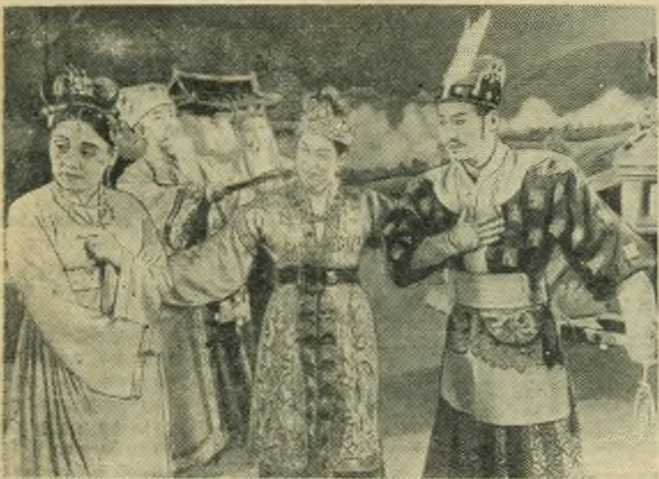
В театрах Коре́йской Народно-Демократической Республики идут спектакли, воспитывающие молодежь в духе патриотизма и любви к родине. Большим успехом пользуется балет «Сказание о крепости Садоген», посвященный героическому прошлому корейского народа. Спектакль поставлен Государственной студией Цой Сын Хи. НА СНИМКЕ: сцена из спектакля.