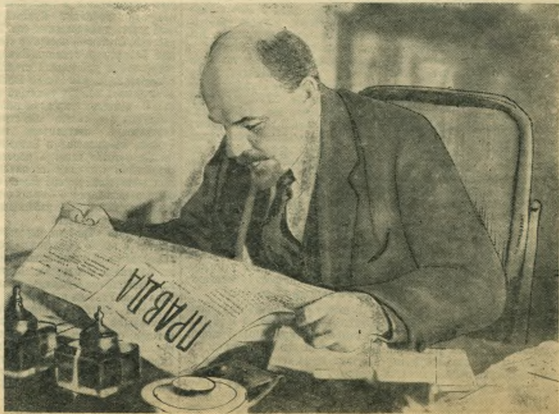
Владимир Ильич Ленин за чтением «Правды» (1920 г.).

Руководимая Коммунистической партией, верная своим славным традициям — всегда и во всем служить народу — советская печать и впредь будет могучим оружием нашей партии в борьбе за построение коммунизма.