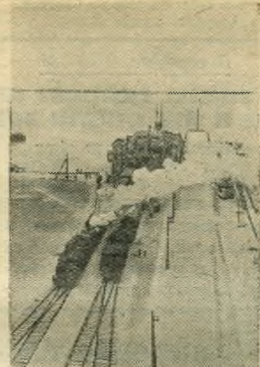
Крымская область. Закончено сооружение паромной железнодорожной переправы через Керченский пролив. Товарные и пассажирские поезда переправляются с Крымского берега на Кубанский и в обратном направлении на крупном железнодорожном пароме — дизель-электророходе.