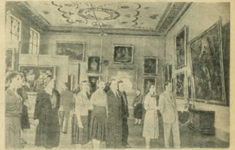
В Москве, в Музее изобразительных искусств имени А. С. Пушкина открылась выставка картин Дрезденской галереи. Выставка будет открыта для общего обозрения в течение мая — августа 1955 года.