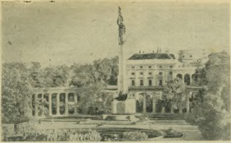
Австрия. Площадь имени Сталина в Вене. Памятник Советским воинам, погибшим при освобождении Вены.