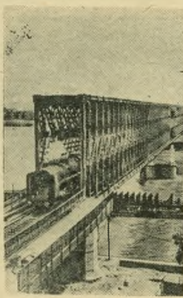
В Венгерской Народной Республике завершено строительство нового Уйпештского моста через Дунай.

Как передает агентство Ассошиэтед Пресс, командование вооруженными силами США на Дальнем Востоке сообщило, что за прошедшие два года на вооружение лисымановских войск, на восстановление и строительство в Южной Корее объектов военного значения израсходовано около полутора миллиардов долларов. (ТАСС).