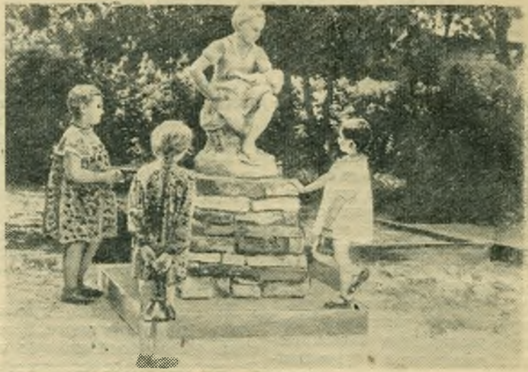
НА СНИМКЕ: уголок детского парка.

Как стало известно, пишет корреспондент, местные организации партии Мусульманская конференция Джамму и Кашмира решили провести демонстрацию протеста против раздачи населению совершенно негодной для потребления американской пшеницы.