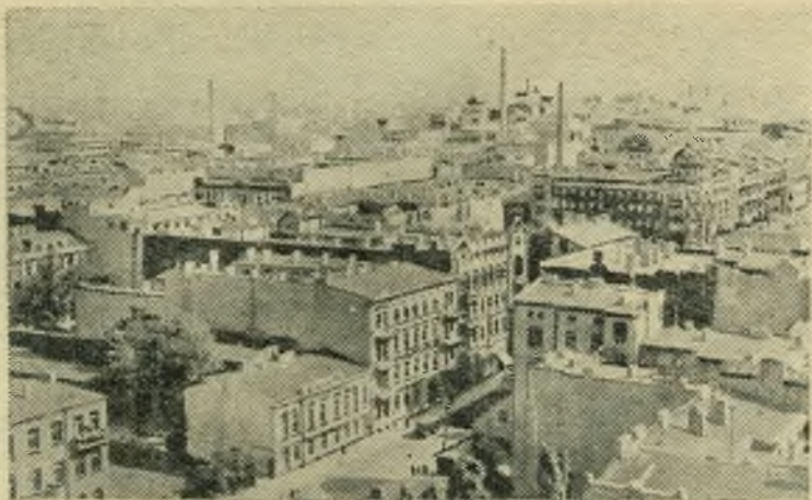
Польская Народная Республика. Лодзь—один из крупнейших промышленных и культурных центров страны.