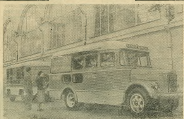
Павловский автобусный завод имени Жданова освоил выпуск новых передвижных автолавок с прицепом для обслуживания сельских местностей. Автолавка имеет отделы—одежды, бакалеи, тканей, обуви и другие. НА СНИМКЕ: передвижная автолавка с прицепом, демонстрируемая на Всесоюзной сельскохозяйственной выставке.

М. Демина, заведующая библиотекой парткома комбайнового завода.