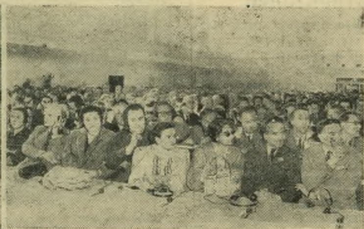
НА СНИМКАХ: (слева направо) выступление председателя Всемирного Совета Мира Жолно Кюри на открытии Всемирной Ассамблеи в зале заседаний.