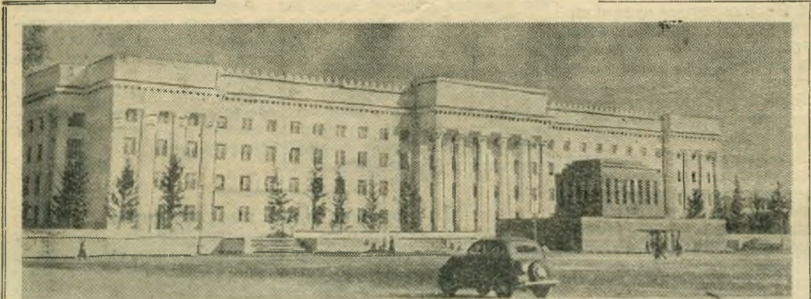
Столица Монгольской Народной Республики — город Улан-Батор. НА СНИМКЕ: здание Совета Министров МНР. На переднем плане — усыпальница Сухэ-Батора и Чойбалсана.