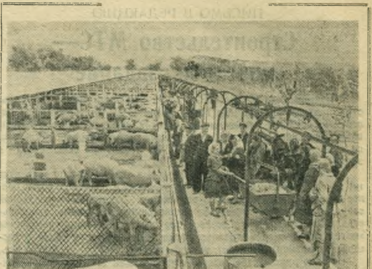
Ставропольский край. Широко известны достижения совхоза «Венцы-Заря» Краснодарского края и колхоза имени Сталина Ново-Александровского района Ставропольского края в выращивании племенных свиней крупной белой породы. Оба хозяйства — участники Всесоюзной сельскохозяйственной выставки. Они держат тесную связь друг с другом, часто обмениваются опытом работы.

Шаг за шагом можно разрешить международные противоречия, и тогда осуществятся надежды народов.