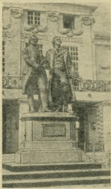
Памятник Гете и Шиллеру у Национального театра в Веймаре.

пины на положение колониального поставщика сырья. Этот закон, пишет газета, поставил страну перед лицом серьезного финансового и экономического кризиса. Так, пассив баланса Филиппин в 1954 году вырос по сравнению с 1953 годом более чем в 2 раза. Жизнь населения становится все тяжелее. Согласно данным филиппинского центрального банка, из 21 миллиона человек населения Филиппин в октябре прошлого года насчитывалось 4.800 тысяч безработных или полубезработных. В феврале текущего года число полностью безработных составило 2 миллиона человек.