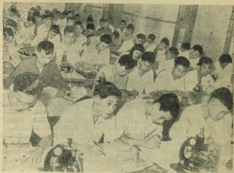
Демократическая Республика Вьетнам. В Ханойском университете учится 1.400 студентов. Университет выпускает врачей, фармацевтов и педагогов.

НА СНИМКЕ: студенты 1-го курса медицинского факультета на лекции.