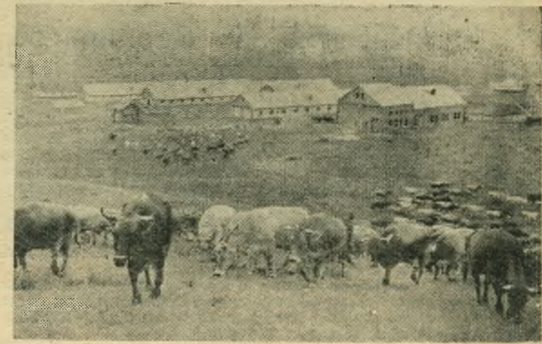
Киргизская ССР. Племенной животноводческий совхоз имени Ильича (Фрунзенская область) из года в год увеличивает поголовье крупного рогатого скота алатауской породы и повышает его продуктивность. Средний надой молока на каждую корову в прошлом году составил 5.072 килограмма.