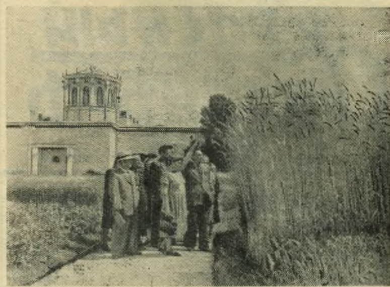
Москва. Всесоюзная сельскохозяйственная выставка. На открытом участке зерновых культур выращена озимая рожь сорта Вятка. Этот сорт обладает высокой зимостойкостью, неполегаетостью. Высота ржи часто достигает более двух метров, урожайность ржи достигает более 30 центнеров с гектара.

НА СНИМКЕ: группа экскурсантов из Копыльского и Дзержинского районов Минской области осматривает озимую рожь сорта Вятка.