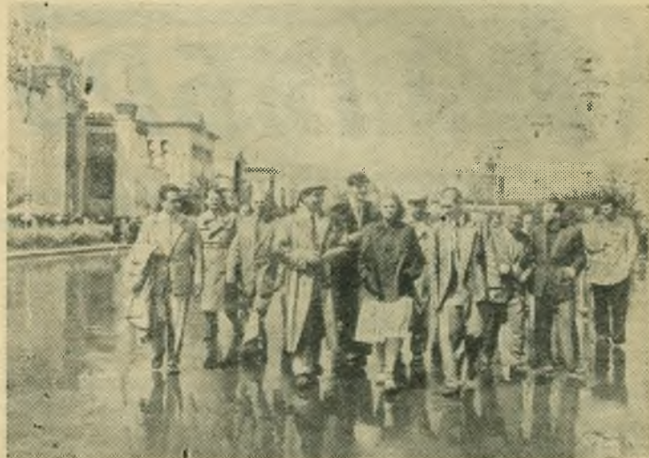
Венгерская сельскохозяйственная делегация во главе с Министром земледелия Венгерской Народной Республики Ф. Эрден посетила Всесоюзную сельскохозяйственную выставку.

НА СНИМКЕ: около павильона Казахской ССР.