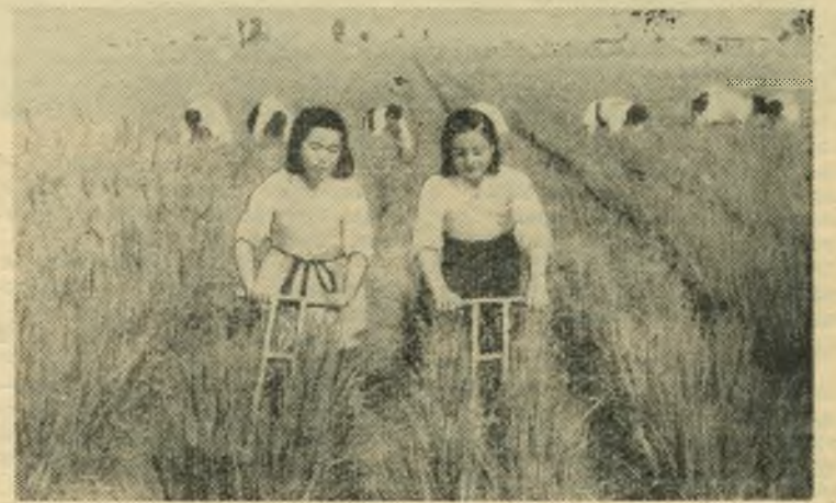
Корейская Народно-Демократическая Республика. На полях сельскохозяйственного кооператива в селе Ренанри уезда Синчен.