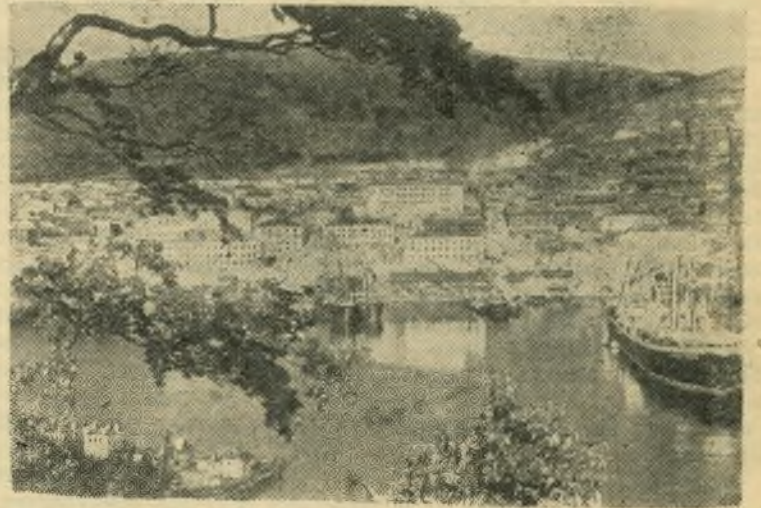
Хабаровский край. Петропавловск-Камчатский.