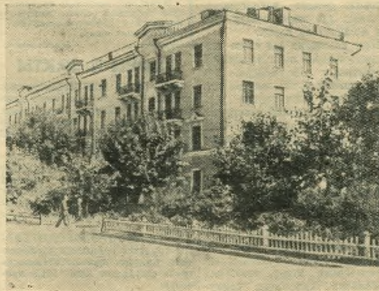
НА СНИМКЕ: новый дом, построенный для железнодорожников на Московской улице.