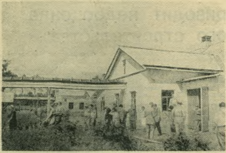
Сельскохозяйственная делегация Соединенных Штатов Америки во время своего пребывания в СССР посетила совхоз «Горки П» Московской области.