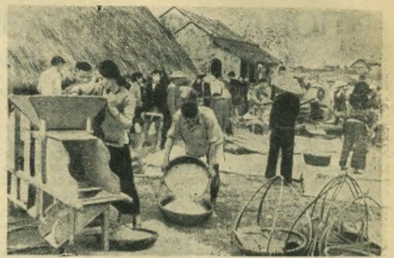
Демократическая Республика Вьетнам. Сдача риса государству.