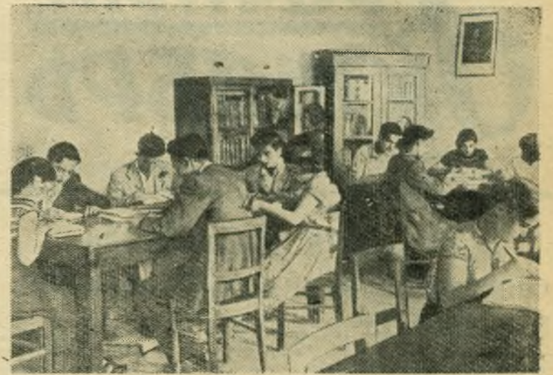
В столице Народной Республики Албании — Тиране работает ряд высших учебных заведений, в том числе планово-экономический институт, педагогический, медицинский, политехнический, сельскохозяйственный, юридический. НА СНИМКЕ: комната для подготовки студентов к занятиям в планово-экономическом институте.