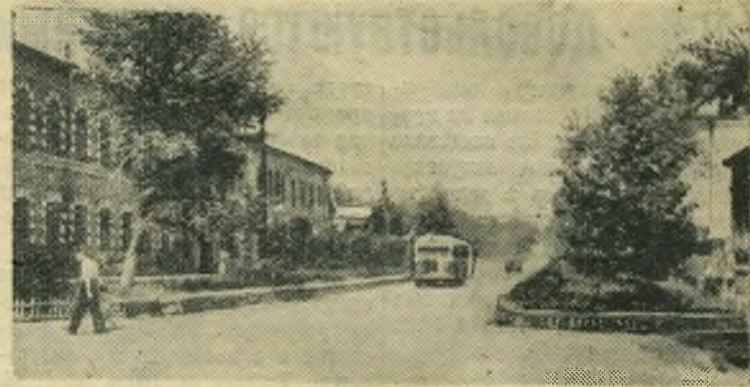
НА СНИМКЕ: Сызрань. Улица имени Володарского.