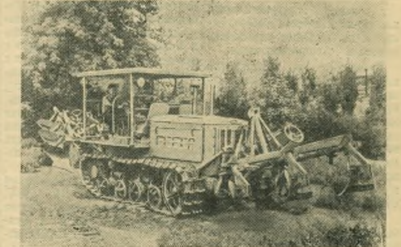
Сталинградский тракторный завод выпустил опытный трактор «ДТ-57 крутосклонный», предназначенный для освоения земель в горных районах страны. Отличие его от трактора «ДТ-54» состоит в том, что он производит работу навесными орудиями, расположенными спереди и сзади.

На тракторном заводе Н. С. Хрущев ознакомился с производством,