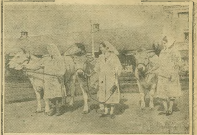
Москва. Всесоюзная сельскохозяйственная выставка. НА СНИМКЕ: показ на выводящем кругу тройки телок костромской породы, родившихся в январе 1954 года от коровы Минь. При рождении общий вес телят равнялся 79 килограммам. Коровы принадлежат племенному совхозу «Караваяво».