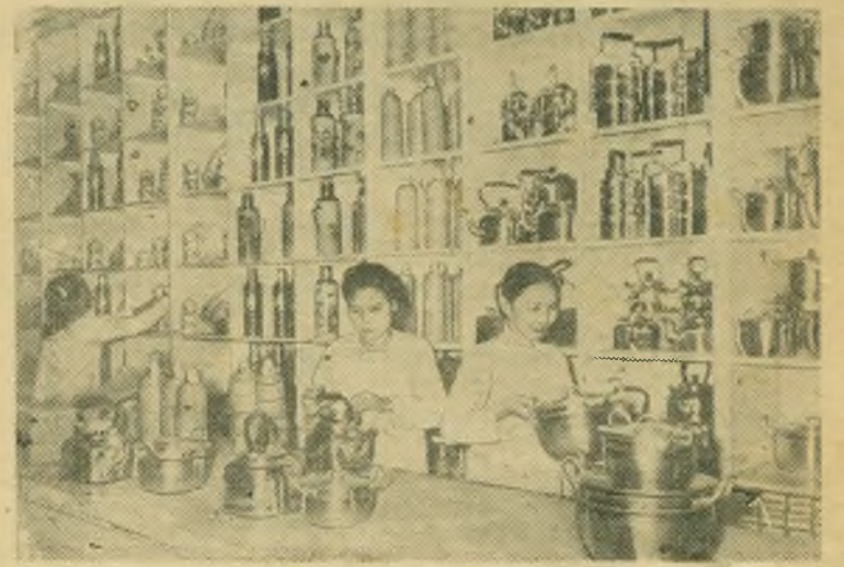
В городах Демократической Республики Вьетнам улучшается торговля. В магазинах появляется все больше и больше товаров повседневного спроса.

НА СНИМКЕ: сотрудницы универсального магазина в Хайфоне готовятся к открытию магазина.