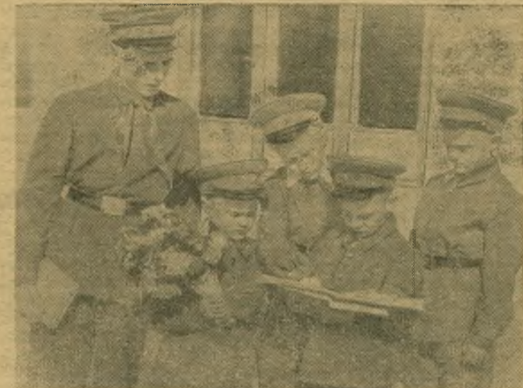
В школах города установилась хорошая традиция: перед началом учебного года проводить так называемый «День встреч». В этот день учащиеся встречаются и знакомятся с учителями, со школой, друг с другом.

Все новое, передовое должно распространяться не только внутри предприятия, но и за его пределы. Хорошо поступил промышленно-транспортный отдел Промышленного райкома КПСС (заведующий тов. Демченко), который организовал районную школу по распространению передовых методов труда. Первое занятие в этой школе состоялось на механическом заводе. На нем рабочие ряда предприятий района изучали способ вихревой нарезки резьб.