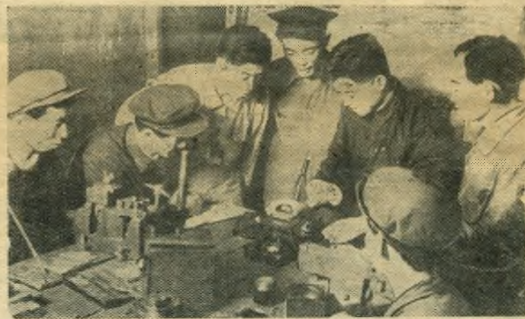
Корейская Народная-Демократическая Республика. Большую помощь оказывают китайские специалисты рабочим Кангского завода электрической аппаратуры. НА СНИМКЕ: китайские специалисты консультируют своих корейских друзей.