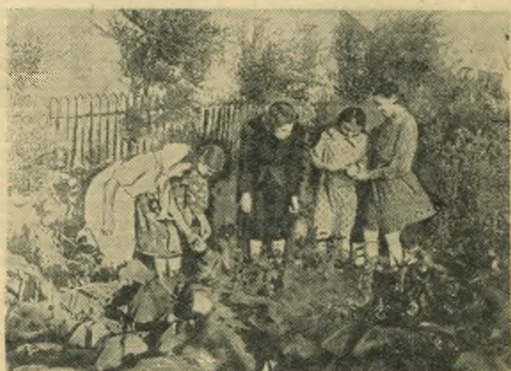
В железнодорожной средней школе № 23 имеется хороший пришкольный участок, за которым любовно ухаживают юннаты. НА СНИМКЕ: юннаты собирают урожай помидоров с пришкольного участка.

Со всех участков стройки поступают вести о достигнутых производственных успехах. Заканчиваются работы на 25 километровом водоподводящем канале. Здесь укладываются последние кубометры бетона, заполнены битумной мастикой все 25 километров температурных швов. Сегодня закончена укладка последних метров дренажных труб. Через несколько дней вода реки Нарвы заполнит крупнейший в нашей стране деривационный канал и подойдет к затворным щитам гидроэлектростанции.