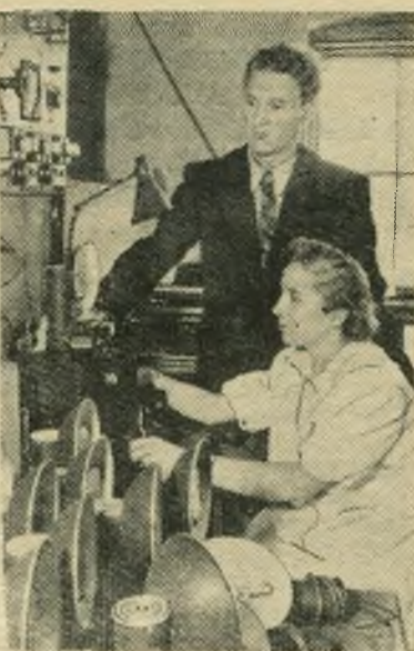
На Московском электроламповом заводе освоен выпуск портативных малогабаритных электронных фотоспешек «Молния».

Строительные организации часто в погоне за выполнением плана в деньгах стремятся выполнить в первую очередь все выгодные в денежном отношении работы, а потом теряют интерес к строящемуся объекту, в результате чего отделка его затягивается, а ста-