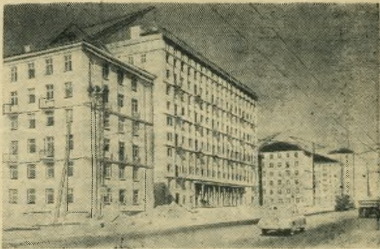
Москва сегодня. Строительство каркасно-панельных жилых домов на 1-й Хорошевской улице.

Сызранскому педагогическому институту срочно требуется на работу мастер учебных мастерских. Обращаться по адресу: Советская, 45, пединститут, к заместителю директора.