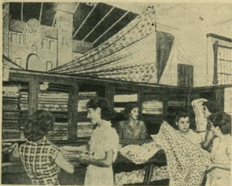
Народная Республика Албания. Тирана. В «Народном магазине».