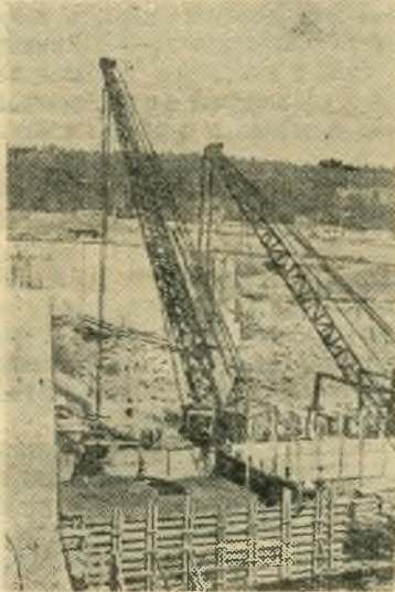
Башкирская АССР. Строители Уфимской ГЭС уложили в стены шлюза свыше ста тысяч кубометров железобетона. Из котлована вынута более одного миллиона кубометров скального грунта.