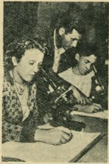
Германская Демократическая Республика. В Гренингене (округ Магдебурга) на базе сельскохозяйственного производственного кооператива «Социализм» работает учебный комбинат «Молодая гвардия». Здесь приобретают необходимые знания и повышают квалификацию члены сельскохозяйственных производственных кооперативов. НА СНИМКЕ: учащиеся в лаборатории.

Агентство Синьхуа сообщает также, что шахтеры новых шахт