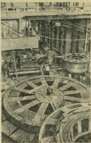
Эстонская ССР. Строительство Нарвской ГЭС вступило в предпосредительный период. Скоро первая турбина даст ток.

НА СНИМКЕ: монтаж узлов второй турбины Нарвской ГЭС.