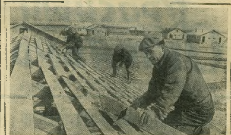
Актюбинская область. Быстрыми темпами ведется строительство в Карабутаковском зерносовхозе. Строители уже возвели в степи десятки жилых домов, столовую, школу, магазин, овощехранилище.

Успех любого дела решают кадры. Поэтому очень важно избрать