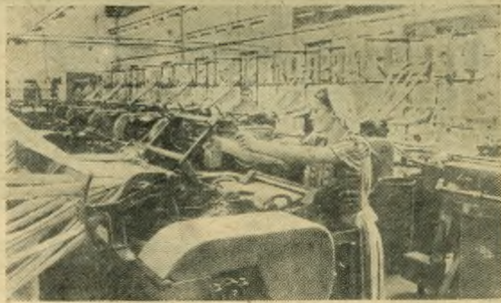
Белорусская ССР. На Минском камвольном комбинате вступили в строй цехи первой очереди — чесальный, прядильный, гребнечесальный и ровничный. Выдана первая продукция пряжи.

НА СНИМКЕ: линия станков гребнечесального цеха.