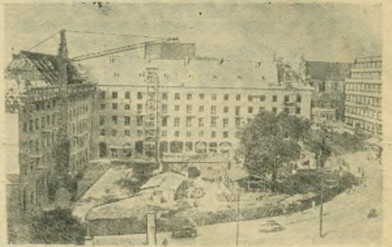
Польская Народная Республика. Строительство жилых домов во Вроцлаве.