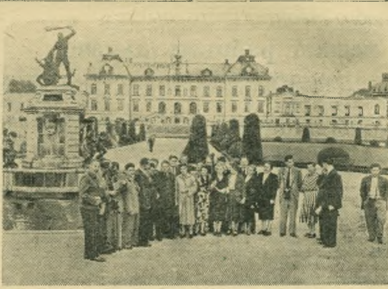
Стокгольм. Пребывание в Швеции группы советских туристов.

В Рангун прибыли также члены Международной комиссии по наблюдению и контролю в Лаосе, по инициативе которой проводятся настоящие переговоры.