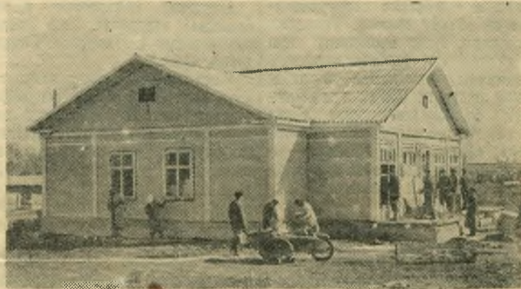
Новосибирская область. Большое строительство идет в совхозе «Кремлевский», созданном на целинных землях. Сейчас здесь заканчивается сооружение столовой, магазина, пекарни, котельной и нескольких жилых домов.

НА СНИМКЕ: строительство магазина на центральной усадьбе совхоза «Кремлевский».