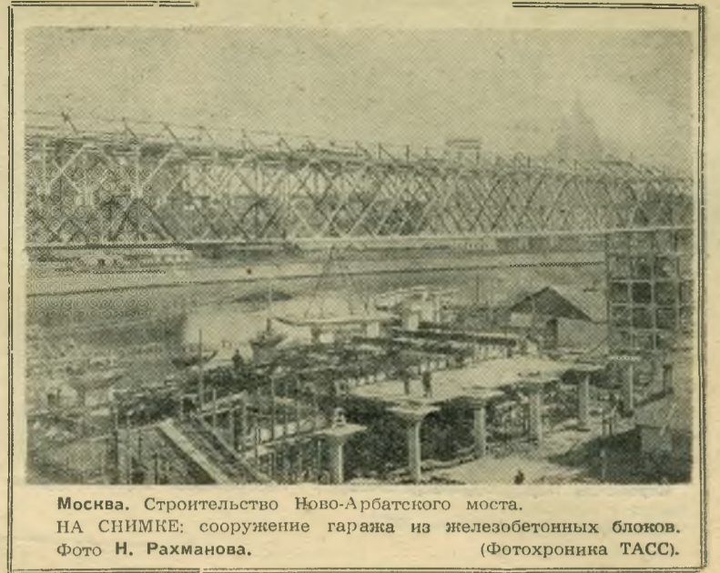
Москва. Строительство Ново-Арбатского моста. НА СНИМКЕ: сооружение гаража из железобетонных блоков.