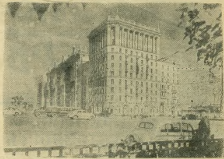
В Москве на Можайском шоссе заканчивается строительство одного из крупнейших жилых домов столицы. В нем будет более тысячи 1—2—3—4-комнатных квартир со всеми удобствами. В доме оборудуется двухзальный кинотеатр, выделены помещения под детские сады, имеется АТС. В нижнем этаже разместятся магазины, парикмахерская, кафе и другие коммунальные предприятия для обслуживания жильцов.

НА СНИМКЕ: общий вид нового жилого здания.