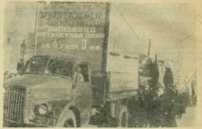
На Октябрьской демонстрации в Сызрани.