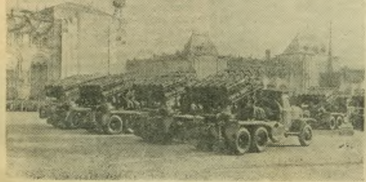
Москва, 7 ноября 1955 года. Празднование 38-й годовщины Великой Октябрьской социалистической революции.

Парад войск Московского гарнизона, Гвардейские минометы на Красной площади.