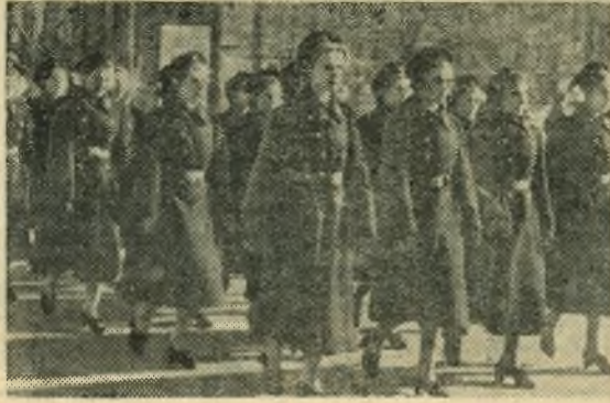
На Октябрьской демонстрации в Сызрани.