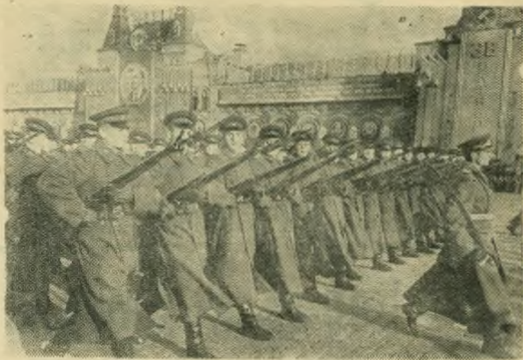
Москва, 7 ноября 1955 года. Празднование 38-й годовщины Великой Октябрьской социалистической революции. Парад войск Московского гарнизона на Красной площади.