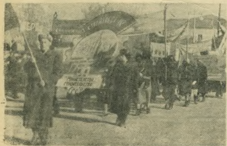
На Октябрьской демонстрации в Сызрани.

Вечером зажглись огни праздничной иллюминации. Весело и радостно праздновали трудящиеся нашего города 38-ю годовщину Великой Октябрьской социалистической революции.