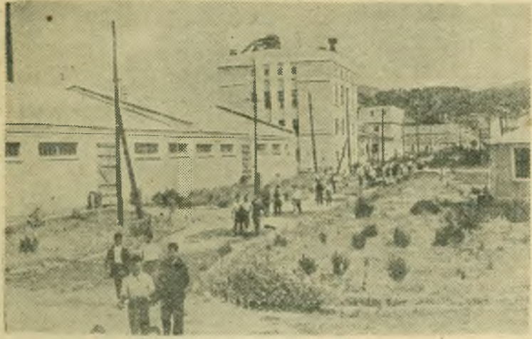
Два года назад в Народной Республике Албании в городе Влора построен таниновый завод. Сейчас он дает кожевенной промышленности до тысячи тонн танина ежегодно.