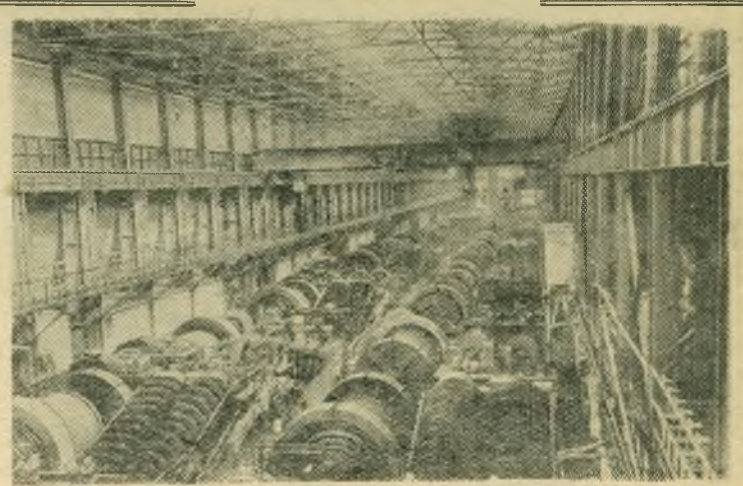
Днепропетровская область. Недавно вступила в строй первая очередь Криворожского Южного горнообогатительного комбината. Это — передовое по своему техническому оснащению предприятие. В основных его цехах осуществлена полная автоматизация управления агрегатами. Началось производство офлюсованного агломерата. Ежегодно комбинат будет выпускать его миллионы тонн. НА СНИМКЕ: внутренний вид обогатительной фабрики.

Сейчас коллектив стройучастка прилагает все усилия, чтобы с честью выполнить задачи, которые партия и правительство ставят перед советскими строителями.