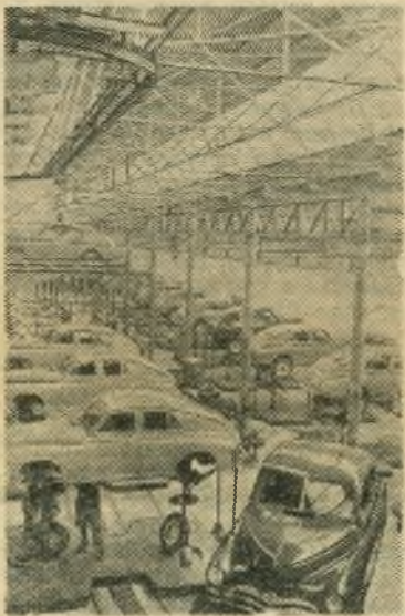
Горький. Автозавод имени В. М. Молотова приступил к выпуску модернизированных легковых автомобилей «Победа».

Товарищ Н. С. Хрущев подчеркнул важное значение задач всестороннего подведения итогов сельскохозяйственного года, обобщения и внедрения опыта передовых хозяйств, обучения колхозных кадров, улучшения дела семеноводства, особенно производства гибридных семян кукурузы, образцового проведения зимовки скота и организованной подготовки к весеннему севу 1956 года.