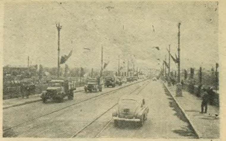
Украинская ССР. В Виннице сдан в эксплуатацию новый железобетонный мост через реку Южный Буг. Он связывает старую часть города с новой.