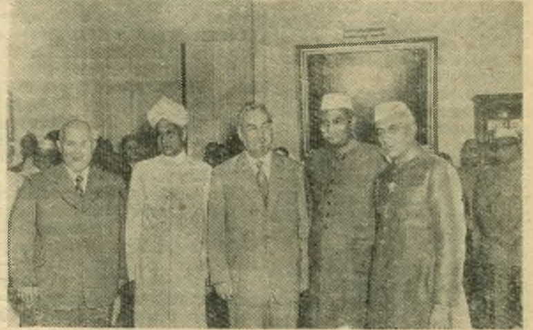
Индия. 20 ноября Президент Республики Индии Раджендра Прасад устроил большой прием в честь Иредседателя Совета Министров СССР Н. А. Булганина и Члена Президнума Верховного Совета СССР Н. С. Хрущева.

Забастовочное движение в капиталистических странах. (4 стр.). Теоретическая конференция в Берлине по случаю 135-летия со дня рождения Фридриха Энгельса. (4 стр.). Польский народ отмечает 100-летие со дня смерти А. Мицкевича. (4 стр.). Открытие музея Адама Мицкевича в Варшаве. (4 стр.). Заявление секретаря ЦК марокканской компартии. (4 стр.).