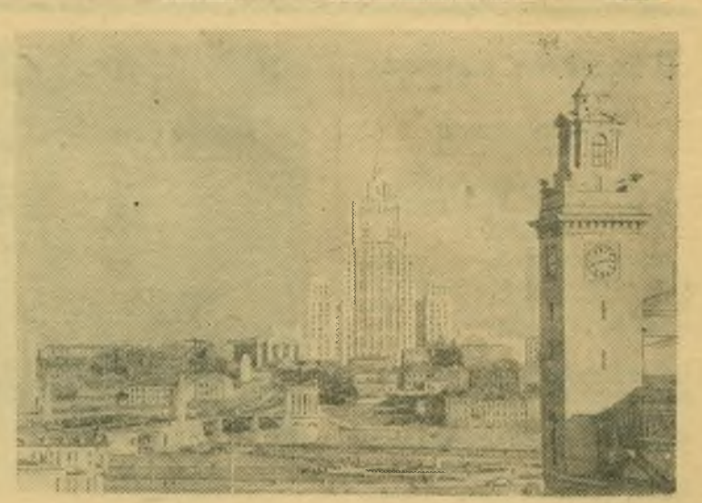
Москва сегодня. Вид на высотное здание на Смоленской площади со стороны Киевского вокзала.