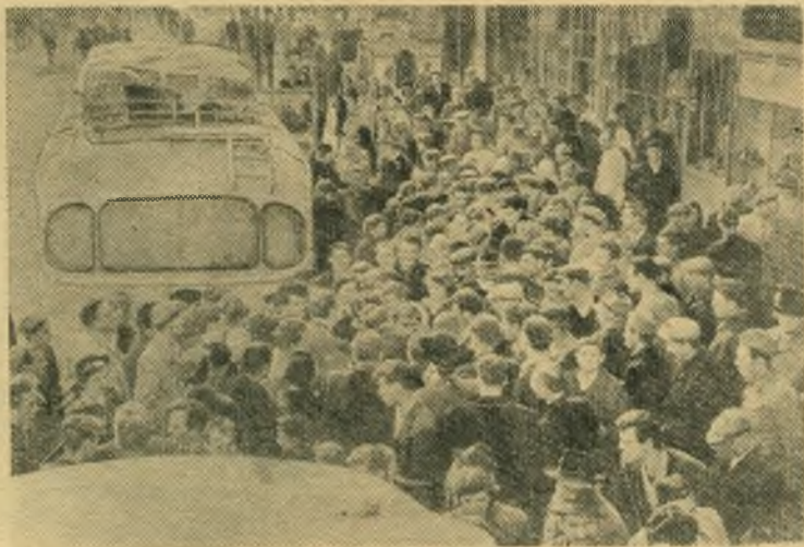
Советские туристы в Югославии. Жители города Ниш беседуют с советскими туристами.