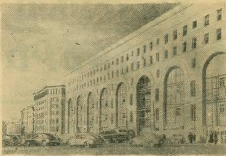
Москва сегодня. Строительство универмага «Детский мир» в Театральном проезде.

На сессии принято решение, в котором определены проблемы и пути дальнейшего улучшения процессов политехнического обучения. (ТАСС).