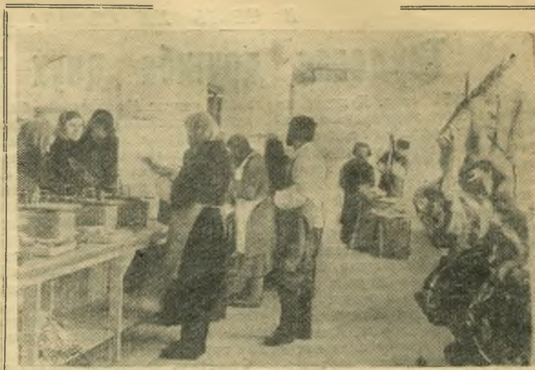
С каждым годом все более благоустраиваются рынки нашего города. На днях на Центральном рынке закончено строительство мясного павильона, на которое израсходовано 230 тысяч рублей. Павильон электрифицирован, панели внутри здания выложены метлахской плиткой. Здесь могут одновременно работать 64 продавца. Заканчивается строительство мясоконтрольной станции с ледником.

группы начальников штаба вооруженных сил США адмиралом Рэдфордом во время пребывания его в Иране. ТЕГЕРАН, 28 декабря. (ТАСС). Газета «Карзар» пишет, что в Иран прибудет большая группа американских офицеров для ознакомления офицерского состава иранской армии с различными видами оружия, применяемыми в авиации и военно-морских силах.