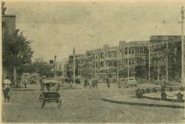
Таиланд. Главная улица в Бангкоке.