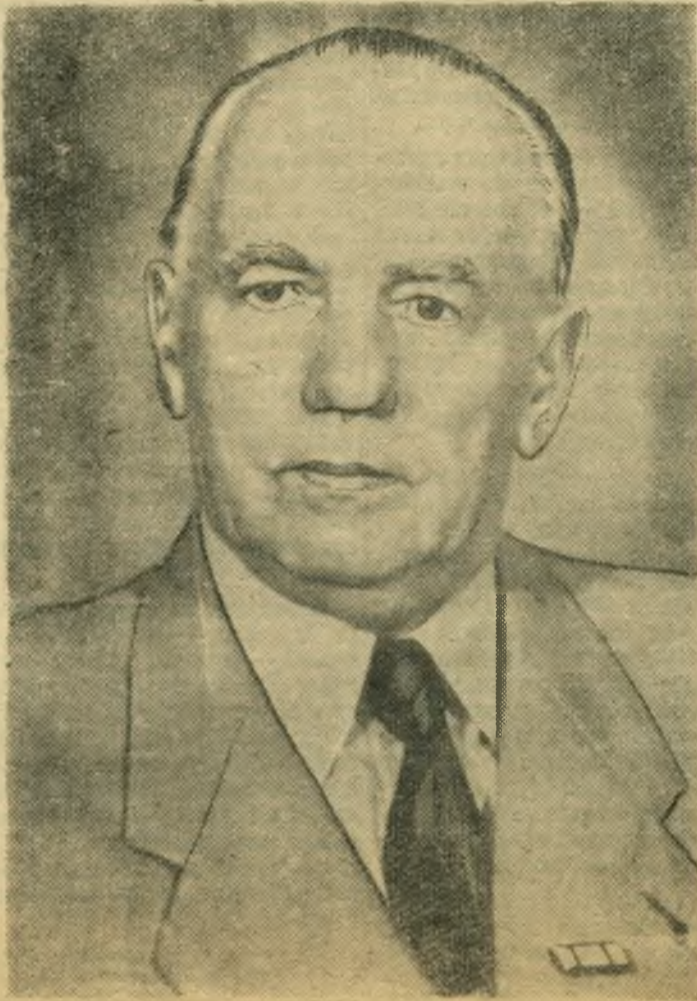
ПРЕЗИДЕНТ ГЕРМАНСКОЙ ДЕМОКРАТИЧЕСКОЙ РЕСПУБЛИКИ В. ПИК