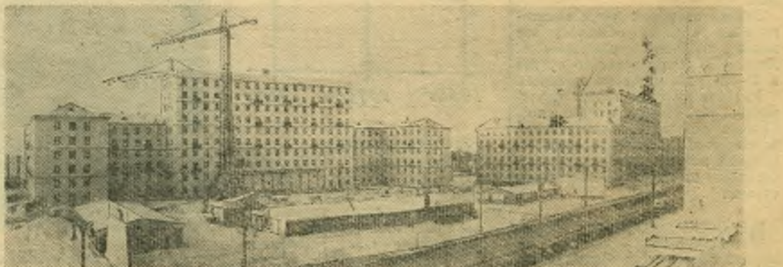
Москва сегодня. Опытное-показательное строительство каркасно-панельных жилых домов на 1-й Хорошевской улице. В этих домах запроектированы одно-двух- и трех-комнатные квартиры со всеми удобствами.

Для его строительства требуется уложить бетона больше, чем было уложено в 13 шлюзов Волго-Донского судоходного канала имени В. И. Ленина. Шлюз будет оснащен совершенными механизмами, которые позволят управлять пропуском судов одному человеку — диспетчеру. (ТАСС).