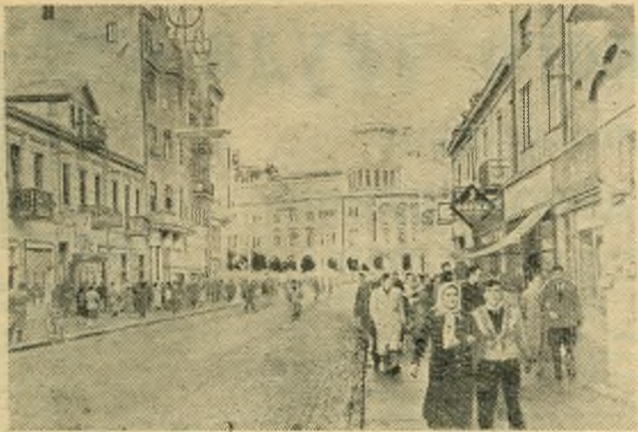
В Федеративной Народной Республике Югославии. НА СНИМКЕ: в городе Скопье.