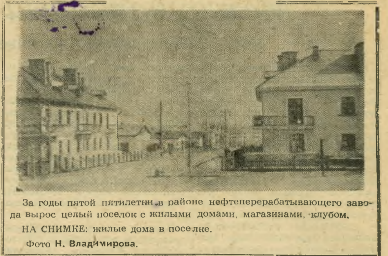
За годы пятой пятилетия в районе нефтеперерабатывающего завода вырос целый поселок с жилыми домами, магазинами, клубом.