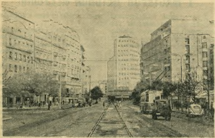
В Федеративной Народной Республике Югославии. НА СНИМКЕ: улица Маршала Тито в Белграде.