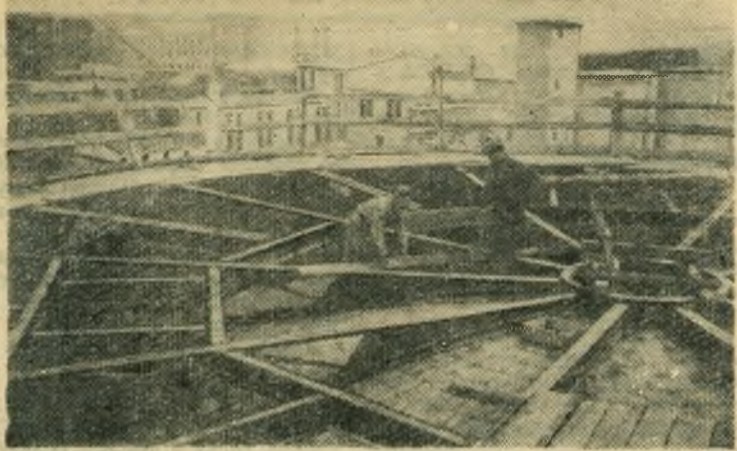
Польская Народная Республика. Азотный завод имени Дзержинского в Тарнуве все в большем количестве выпускает удобрения и ядохимикаты для сельского хозяйства. По сравнению с 1938 годом предприятие увеличило выпуск в 3,5 раза. Сейчас ведутся работы по расширению завода. В новом пятилетнем плане предусматривается шестикратный рост производства.

НА СНИМКЕ: строительство нового цеха на азотном заводе имени Ф. Дзержинского.