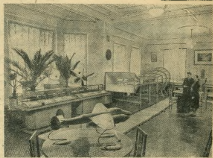
Москва. На днях состоялось торжественное открытие научно-мемориального музея великого русского ученого Н. Е. Жуковского. Открытие музея приурочивается к 109-й годовщине со дня его рождения. Собранные в музее многочисленные экспонаты иллюстрируют жизненный и творческий путь ученого, историю созданных им научных и учебных учреждений и историю отечественной авиации за 47 лет.

го дома и брошена на расположенную рядом строительную площадку. Убито два человека и несколько рабочих нанесены увечья. Газеты сообщают, что многие суда в датских водах оказались в бедственном положении.